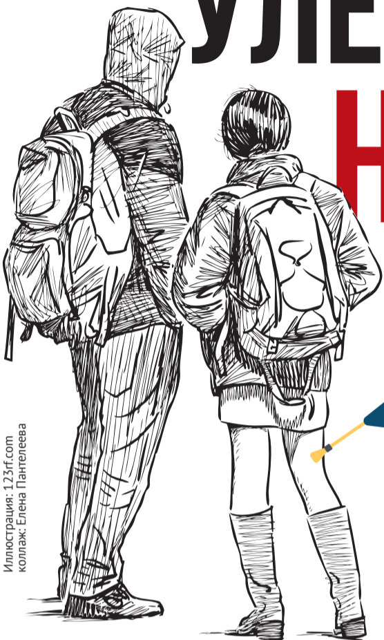
Иллюстрация: 123rf.com Коллаж: Елена Пантелеева

С каждым годом всё больше молодых ребят – выпускников вузов и средних образовательных учреждений – навсегда уезжают из Волгоградской области. Почему молодежь стремится продолжить обучение и реализовать свой потенциал где-то ещё, а не на родной земле?