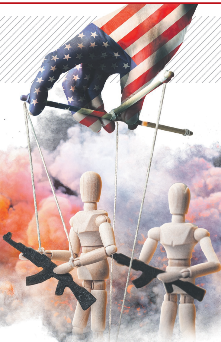
Фото: 123rf.com, коллаж: Алексей Беленёв

Россия, к разочарованию американских политтехнологов, с началом СВО не только не развалилась, но и приросла ещё четырьмя регионами — ДНР, ЛНР, Запорожской и Херсонской областями.