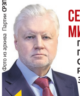
СЕРГЕЙ МИРОНОВ Председатель Партии СПРАВЕДЛИВАЯ РОССИЯ — ЗА ПРАВДУ

Там командуют матёрые, убеждённые бандеровцы. А когда командир — идейный нацист, то подчиненным трудно оставаться не нацистами. Это как в гитлеровском вермахте: кто там был хорошим и не замаранным в военных преступлениях? Не удивительно, что и в украинском «вермахте» в порядке вещей пытки и убийства пленных, что здесь нередки случаи, когда командиры-нацисты приказывают подчиненным выступать в роли карателей и расстреливать мирных жителей, заподозренных в симпатиях к России.