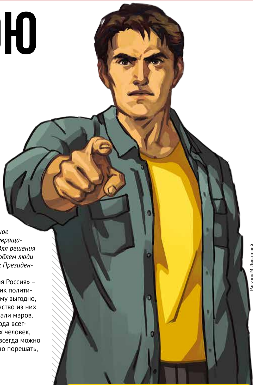
Рисунок М. Липатовой

Но надежда есть! Есть еще в России города, в которых удается отстоять право граждан выбирать мэров напрямую. И происходит это обычно благодаря СПРАВЕДЛИВОЙ РОССИИ – ЗА ПРАВДУ . Так, совсем недавно в Амурском районе Хабаровского края принципиальная позиция справедливороссов сохранила жителям право голоса. Социалисты проголосовали против законопроекта об отмене прямых выборов, и единороссам не удалось его протолкнуть.